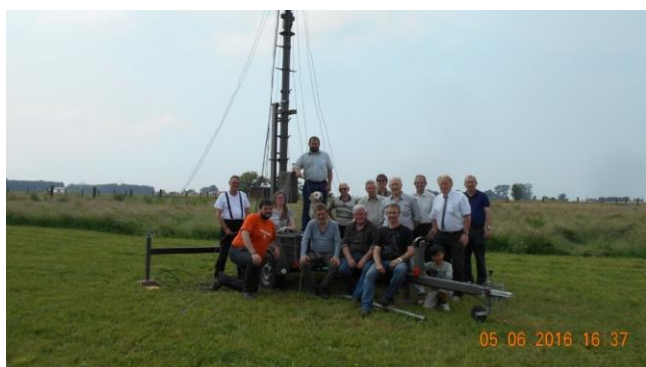
United we stand. Het VHF velddagteam.

De strijd is gestreden, het stof is gaan liggen, de vlaggen zijn gestreken. Het was me het velddagweekendje wel. Hamspirit, dynamisme en vrolijkheid in beide TLS-kampen. Congrats aan alle medewerkers!