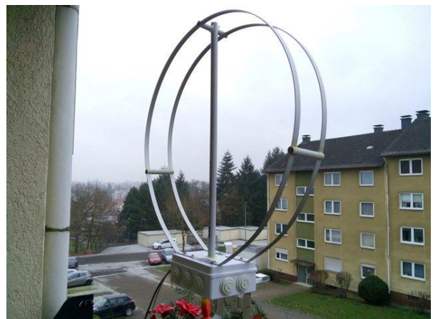
De magnetic loop antenne van Klaus DD2DR, floraversie en naakte versie.