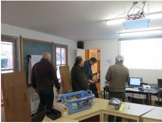
Zullen we eraan beginnen?

Met de antenne-ingang afgesloten op 50 \Omega werd een MDS (het HF-sigitaal dat een audiosigitaal produceert van 3dB boven de ruis) vastgesteld van -111 dBm. Uitschakelen van het ingangscircuit van de Red Pitaya en een aanpassing tussen de meetzender en de antenne-ingang met een 1:9 impedantietransfo toonde een MDS van -122 dBm. Zeker niet slecht en ruimschoots voldoende voor het beluisteren van signalen op de lage banden waar de "noise level" hoog is.