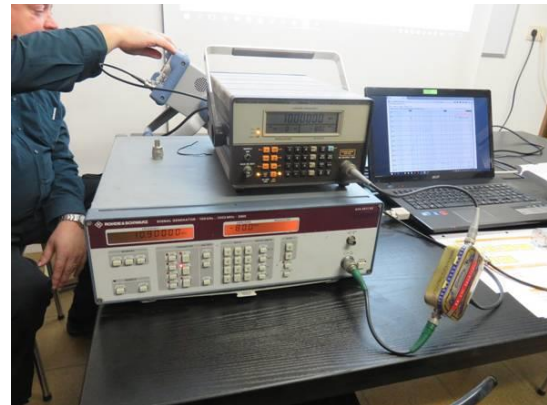
Een deel van de meetopstelling.

De IMD van 2 de orde en 3 de orde bleek veel minder goed. Met de 50 \Omega afsluitweerstand werd een IP_2 gemeten van -5 tot -1 dBm en een IP_3 = 1,5 tot -3 dBm (voor het meten van de IMD van 3 de orde hebben we de antenne-ingang gevoed met 2 signalen met een verschilfrequentie van 5 kHz). De IP_2 zal zeker verbeteren met banddoorlaatfilters aan de ingang. Maar wat met de IP_3 ? Ook de audiodistorsie van sterke signalen en de flanksteilheid van het instelbare bandbreedtefilter blijven heikele punten.